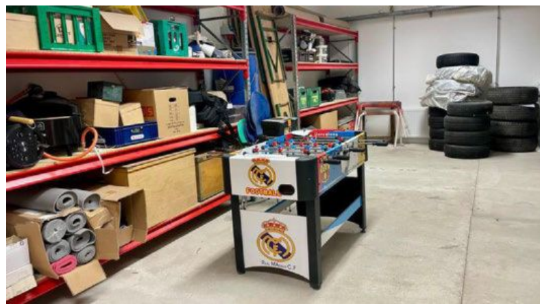
Sikringsrummet i Ebeltoft er fyldt med bogreoler, ting og også et bordfodboldbord. Flere lignende rum i Danmark bruges også til opbevaring eller lejes ud til foreninger, og det er først, når Forsvarsministeriet påbyder at rummene klargøres, at kommunerne skal sørge for, at de er klar.

»For det første er der kommet andre våben siden dengang, rummene blev lavet, så jeg er ikke sikker på, de ville hjælpe meget alligevel, hvis vi blev angrebet fra luften. Det tror jeg dog ikke kommer på tale. Jeg tror, cyberkrigen er det, vi skal forberede os på, så i stedet for at være bange for at man ikke kan få plads i et beskyttelsesrum, så er det bedre at forberede sig derhjemme, så man kan klare sig 3-4 dage uden strøm og så videre. Det er jo også det, de danske myndigheder officielt anbefaler.«